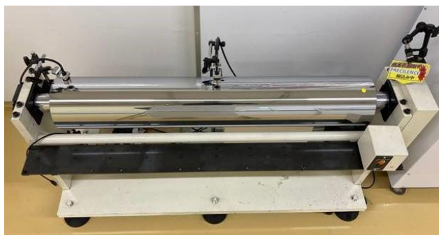
高精度ロールユニット

ロールを回転させながら、ロール振れ精度の良さをデモ機にて実演し、塗工面精度の向上や歩留まり向上への貢献をご紹介します。また、塗工装置の設計や組付け時の困りごとに対するソリューションをご提案します。